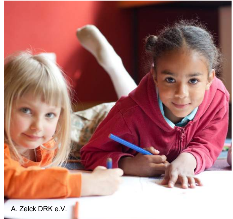
A. Zelck DRK e.V.